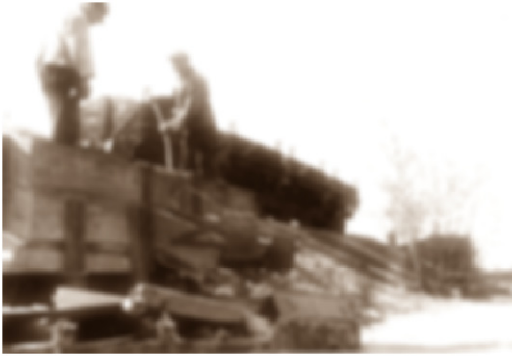
GoPr-012 Bf Gommern 1964 - Güterumschlag Hochrampe.tif