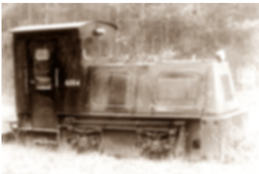
GoPr-004 DR-Kleindiesellok Kö 6004 Bbf Pretzien 1979.tif