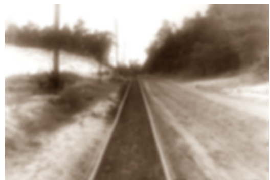
GoPr-009 Streckengleis Gommern - Pretzien 1964.tif