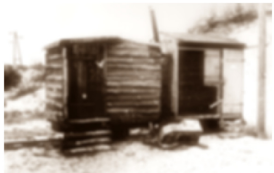
GoPr-017 Gerätewagen mit Frühstücksbude Bbf Pretzien 1969.tif