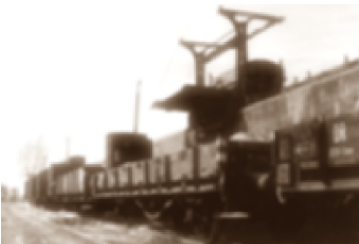
GoPr-016 Bf Gommern 1958 - Hochrampe mit Kippvorrichtung.tif