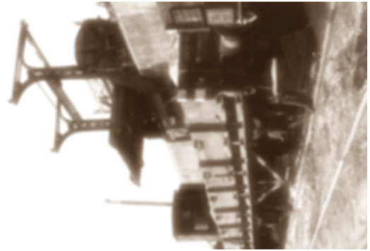
GoPr-013 Bf Gommern 1964 - Hochrampe mit Kippvorrichtung.tif