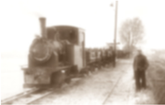
GoPr-002 Henschel-Lok auf der Verladerrampe in Gommern 1964 (GM).tif