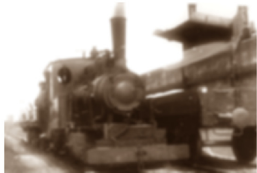
GoPr-015 Henschel-Lok an der Hochrampe Gommern 1964.tif