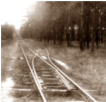
GoPr-014-2 Ausweiche Gommern - Pretzien (05-1976).tif