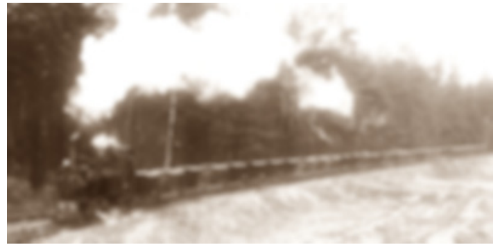
GoPr-001 DR-Lok 99 4301 vor Loren-Zug bei Pretzien 1966.tif