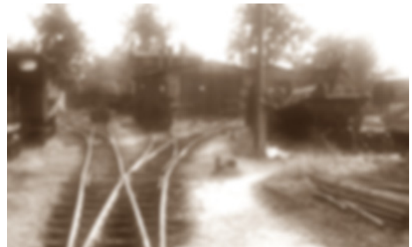
GoPr-007 Bbf Pretzien 1969.tif