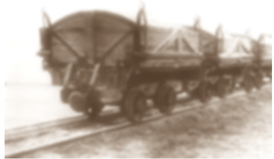
GoPr-003 Holzkipploren in Gommern 1964 (GM).tif