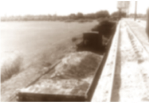
GoPr-010 Bf Gommern 1964 - Hochrampe.tif