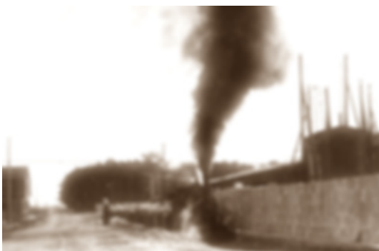
GoPr-008 Henschel-Lok mit Zug am Betonwerk Pretzien 1964.tif