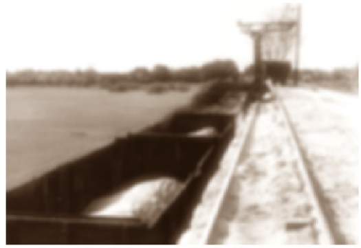
GoPr-011 Bf Gommern 1964 - Hochrampe.tif