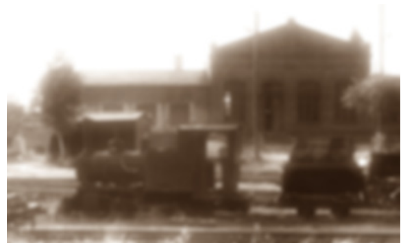
GoPr-005 B-n2t-Feldbahnlok im Bbf Pretzien 1969 (HR).tif